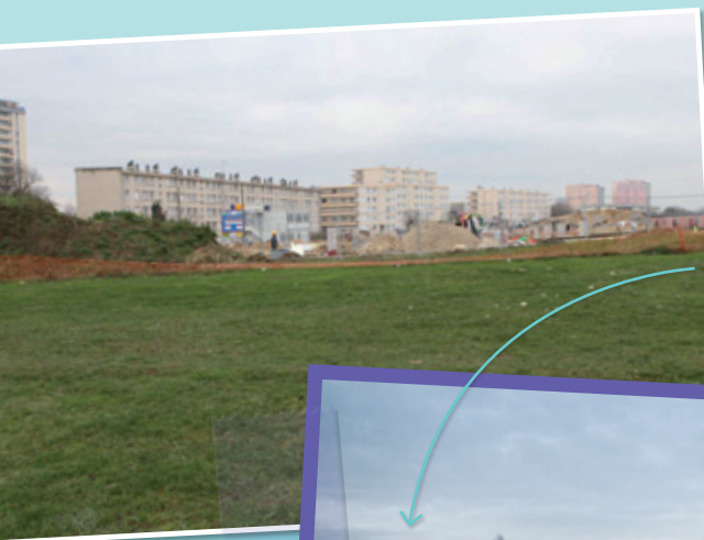
Future Maison de Santé Pluri-professionnelle