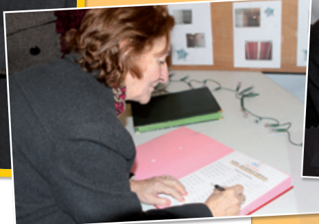
Une locataire de la Cité Jules Guesde