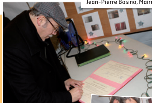
Jean-Pierre Bosino, Maire de Montataire