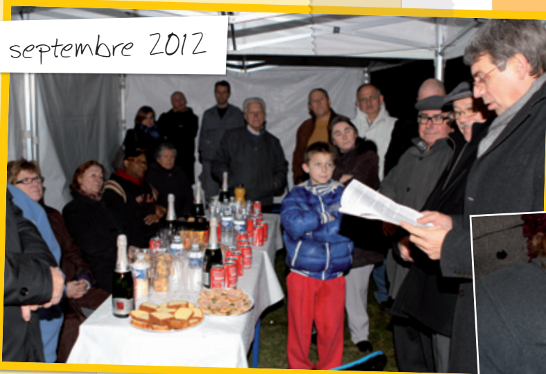
Signature de deux nouvelles chartes d'escalier au 5 et 9 Cité Jules Guesde